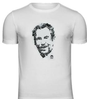
Tričko Fora 2000 – Václav Havel