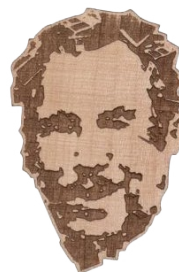
Forum2000 Brooch Made by BeWooden

Pro koupi našich produktů navštivte: bit.ly/Forum2000merch